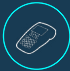
TERMINAUX DE PAIEMENT ÉLECTRONIQUES