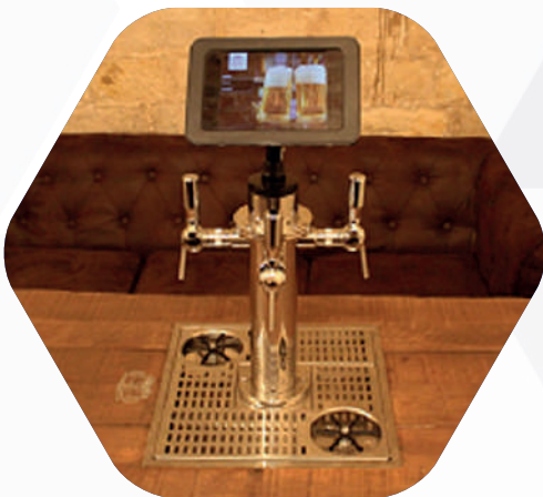
TABLE À BIÈRE